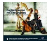
Small Talk ISBN 978-3-89747-629-5 € 16,90