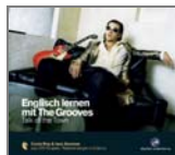
Talk of the Town ISBN 978-3-89747-587-8 € 16,90