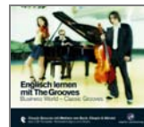
Business World ISBN 978-3-89747-630-1 € 16,90