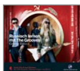
Russisch ISBN 978-3-89747-598-4 € 16,90