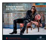
Türkisch ISBN 978-3-89747-853-4 € 16,90