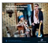
Französisch ISBN 978-3-89747-736-0 € 16,90