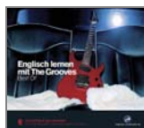
Best Of ISBN 978-3-89747-628-8 € 16,90