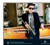
Italienisch ISBN 978-3-89747-737-7 € 16,90