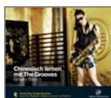
Chinesisch ISBN 978-3-89747-599-1 € 16,90