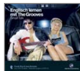
Small Talk ISBN 978-3-89747-584-7 € 16,90