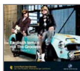
Englisch ISBN 978-3-89747-736-0 € 16,90