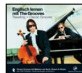
Travelling ISBN 978-3-89747-855-8 € 16,90