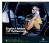
Flirting & Dating ISBN 978-3-89747-588-5 € 16,90