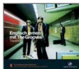
Travelling ISBN 978-3-89747-586-1 € 16,90