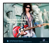
Griechisch ISBN 978-3-89747-854-1 € 16,90