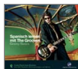
Spanisch ISBN 978-3-89747-631-8 € 16,90