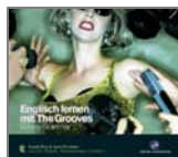
Groovy Grammar ISBN 978-3-89747-585-4 € 16,90