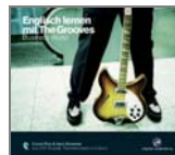
Business World ISBN 978-3-89747-589-2 € 16,90