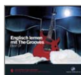
Englisch lernen mit The Grooves Best Of ISBN 978-3-89747-628-8 € 16,90