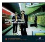
Englisch lernen mit The Grooves Travelling ISBN 978-3-89747-586-1 € 16,90