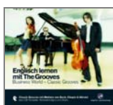
Englisch lernen mit The Grooves Classic Grooves: Business World ISBN 978-3-89747-630-1 € 16,90