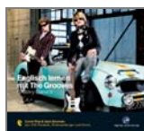
Englisch lernen mit The Grooves Groovy Basics: Englisch ISBN 978-3-89747-735-3 € 16,90