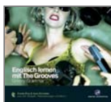
Englisch lernen mit The Grooves Groovy Grammar ISBN 978-3-89747-585-4 € 16,90