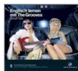
Englisch lernen mit The Grooves Small Talk ISBN 978-3-89747-584-7 € 16,90