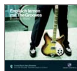
Englisch lernen mit The Grooves Business World ISBN 978-3-89747-589-2 € 16,90