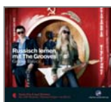
Russisch lernen mit The Grooves Groovy Basics: Russisch ISBN 978-3-89747-598-4 € 16,90