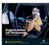
Englisch lernen mit The Grooves Flirting & Dating ISBN 978-3-89747-588-5 € 16,90