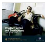
Englisch lernen mit The Grooves Talk of the Town ISBN 978-3-89747-587-8 € 16,90