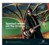
Spanisch lernen mit The Grooves Groovy Basics: Spanisch ISBN 978-3-89747-631-8 € 16,90