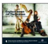
Englisch lernen mit The Grooves Classic Grooves: Small Talk ISBN 978-3-89747-629-5 € 16,90