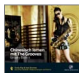
Chinesisch lernen mit The Grooves Groovy Basics: Chinesisch ISBN 978-3-89747-599-1 € 16,90